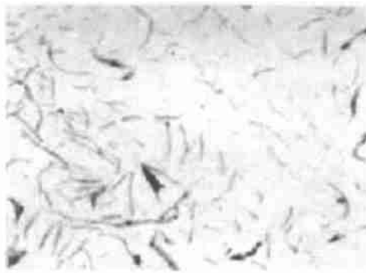
图 1 未增碳试样的石墨组织

成了大量弥散分布的非均质结晶核心，降低了铁液的过冷度，促使生成以 A 型石墨为主的石墨组织；同时，由于生铁用量少，其遗传作用大为削弱，因此使 A 型石墨片分枝发达不易长大，使得石墨短小且均匀，见图 1 和图 2 [7] 。